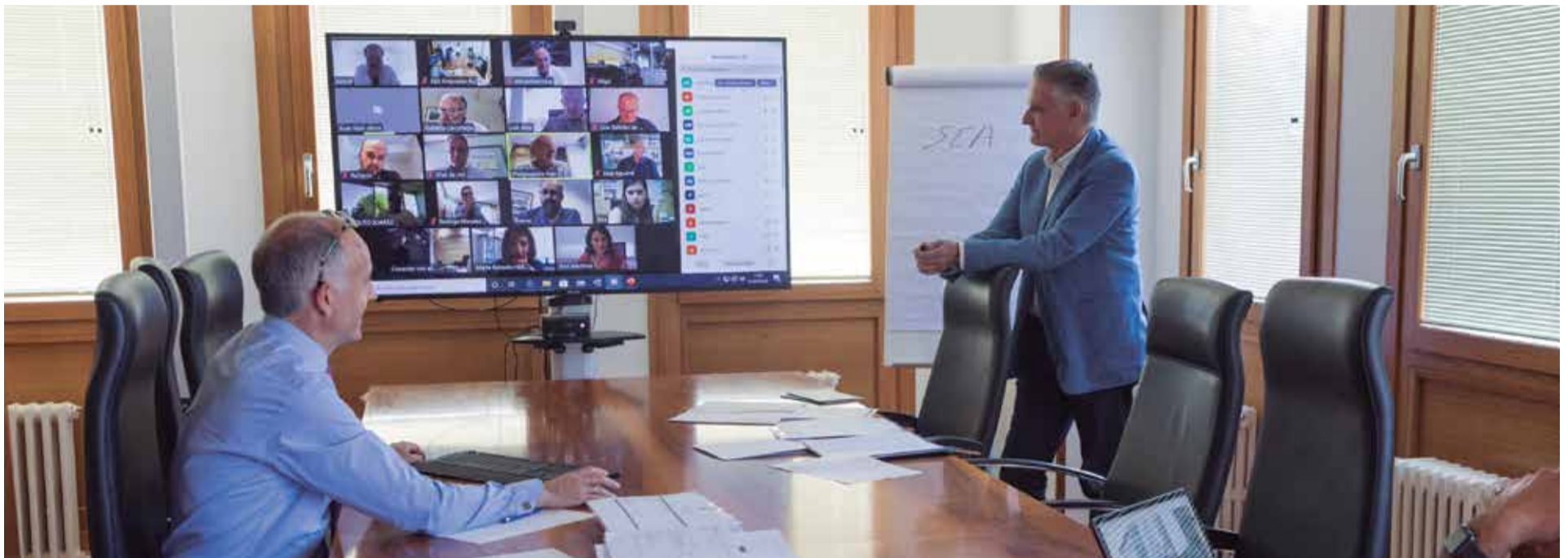
La Junta Rectora previa a la Asamblea General hubo de celebrarse mediante videoconferencia