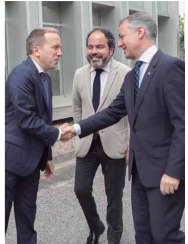
El Foro de Grandes Empresas contó con la participación del Lehendakari Urkullu